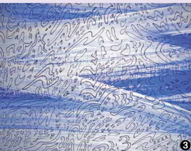
3 4 www.atelierstaufferboxler.ch

Kulinarisches: Bündnerplättli und Bio-Fleisch vom Grill